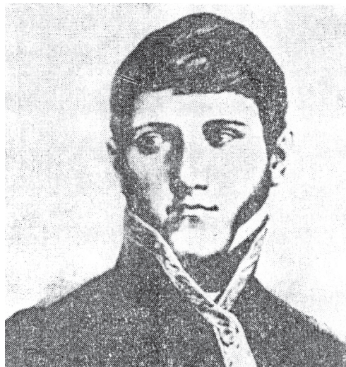
GRAL. FRANCISCO JAVIER MINA Nació en la Ciudad de Pamplona, el 3 de Diciembre de 1789. Fué fusilado en el Cerro de El Bellaco, el 11 de Noviembre de 1817.

Treinta y un hombres de la guarnición fueron pasados por las armas. Pocos días antes el General y sus tropas hubieran visto con horror este sacrificio; pero en aquellas circunstancias pareció necesario. Para evitar nuevas atrocidades será preciso castigar las cometidas. Mina sin embargo detestaba este espíritu vindicativo, y la ocasión que acabamos de indicar es la única en que se le puede echar en cara una severidad excesiva.